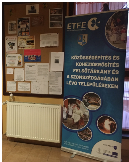
Információs pont a Faluházban

a település muzeális intézményekről, a nyilvános könyvtári ellátásról és a közművelődésről szóló 1997. évi CXL. törvény 83/A. §-a szerinti közművelődési rendeletének felülvizsgálata és megújítása. A közösségi interjúk, felmérés és beszélgetésekre alapozva a közösségi műhelyen a lakosság bevonásával elkészült a projekt teljes időszakát magába foglaló Helyi Cselekvési Terv. A cselekvési terv magába foglalja a