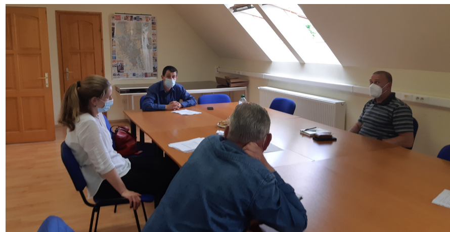
Civil kerekasztal ülés